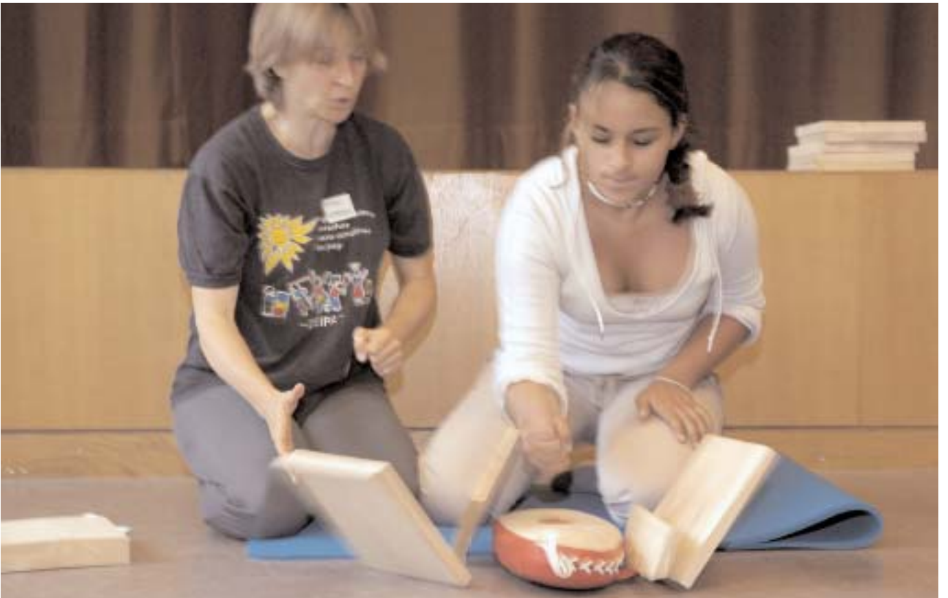
___EIN HOLZBRETT MIT BLOSSER FAUST ZERSCHLAGEN