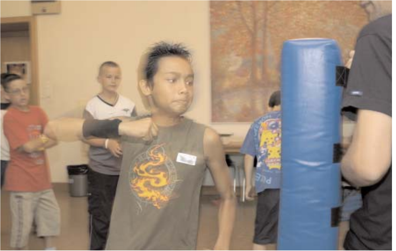
___DIE EIGENE KRAFT SPÜREN