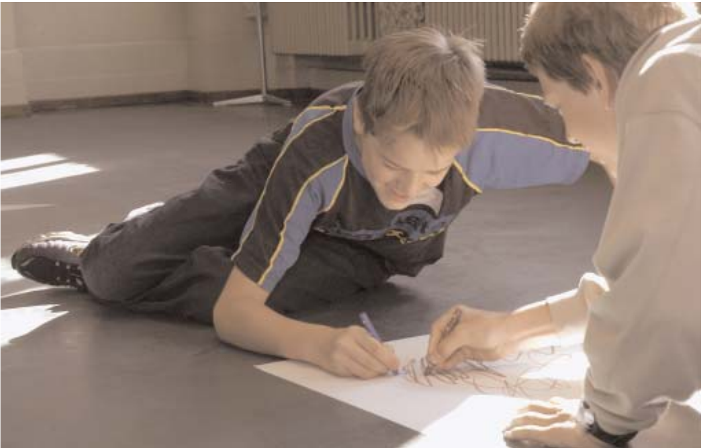
___EINANDER GRENZEN SETZEN