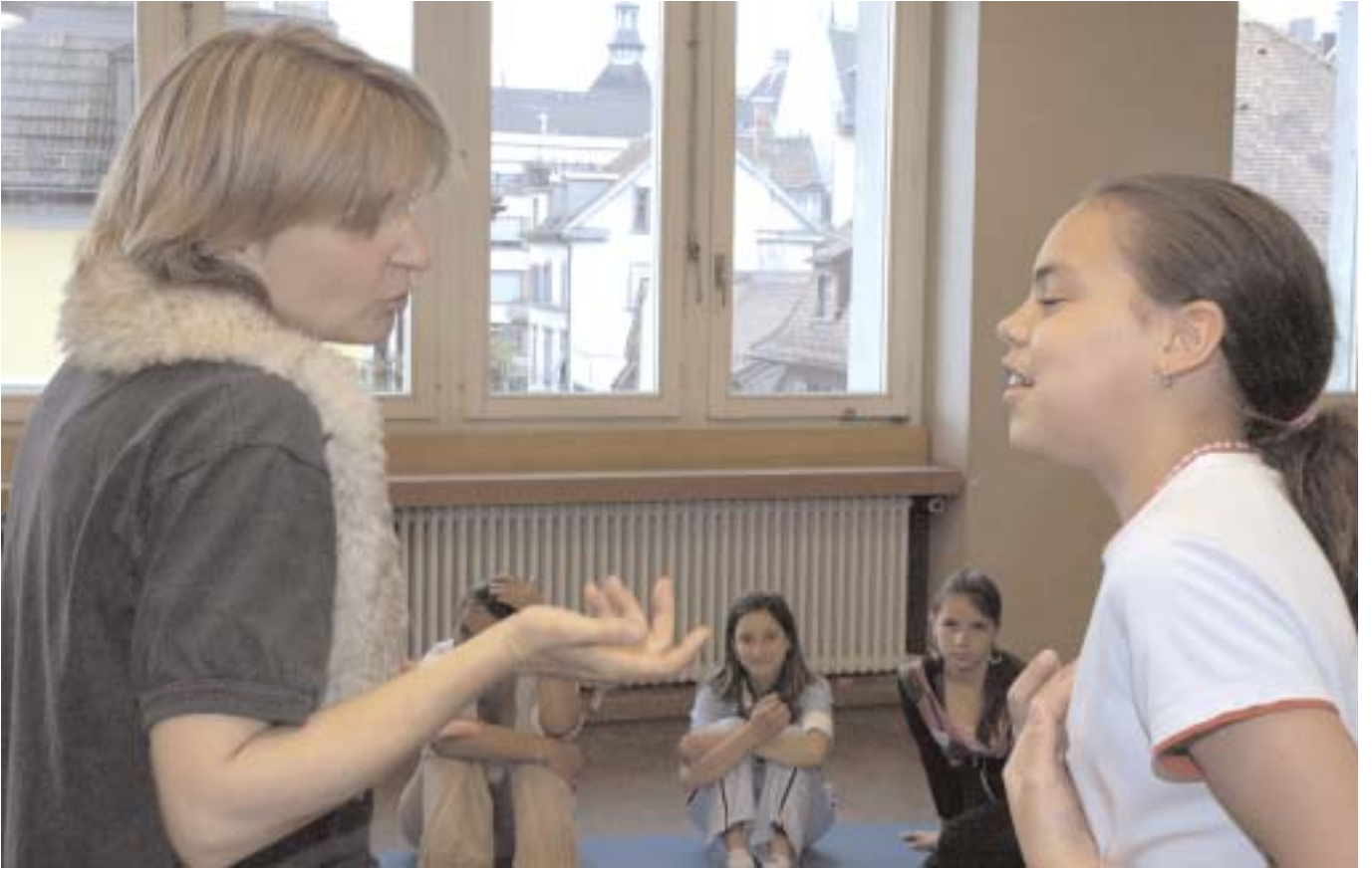
___SICH MIT WORTEN WEHREN