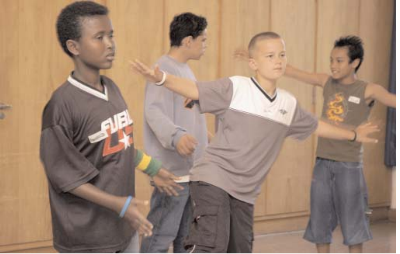
___DAS GLEICHGEWICHT HALTEN