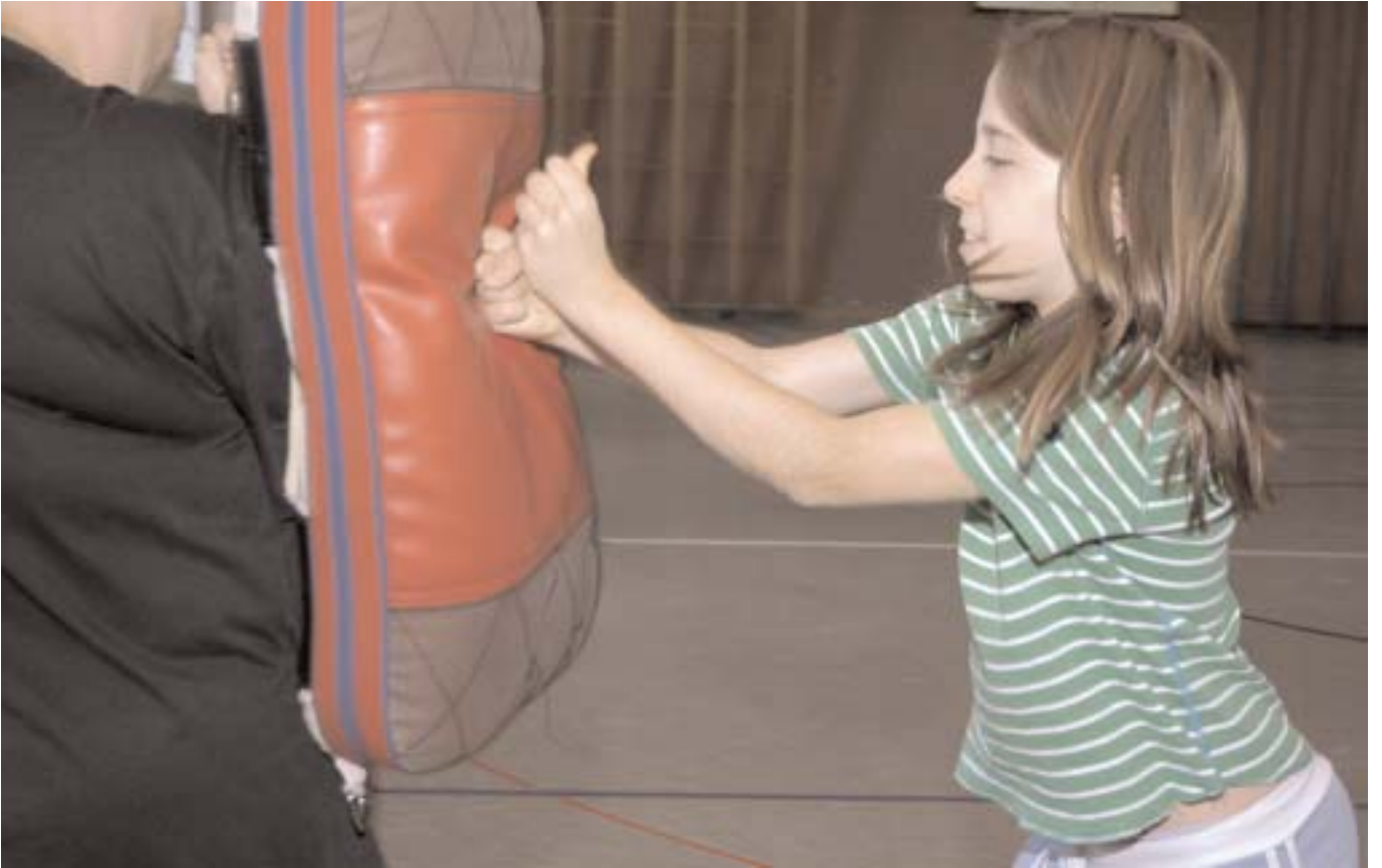
—GEGENSCHLÄGE MIT DEN FÄUSTEN