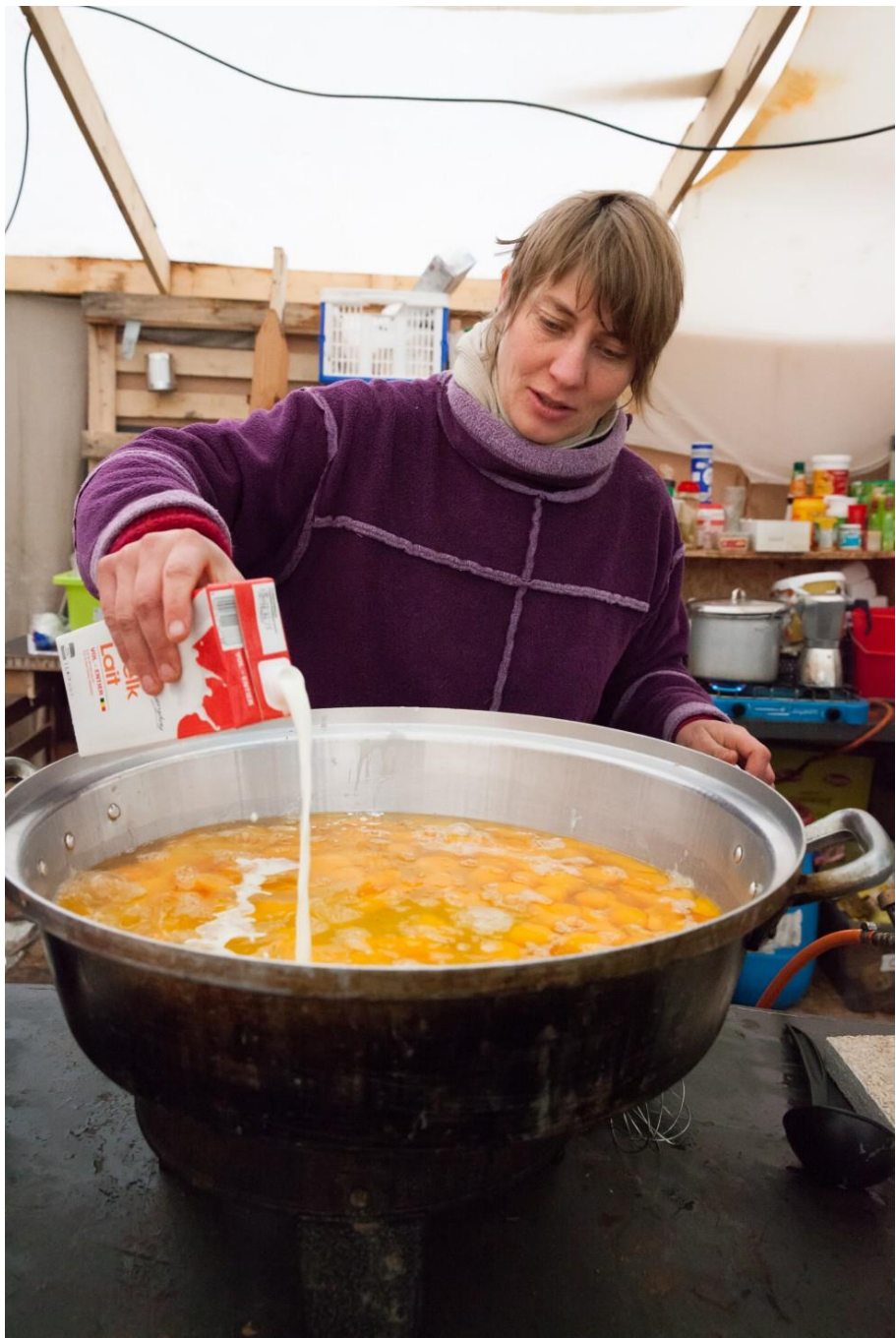
Aktion Rastplatz, Babska am Grenzübergang von Serbien nach Kroatien.