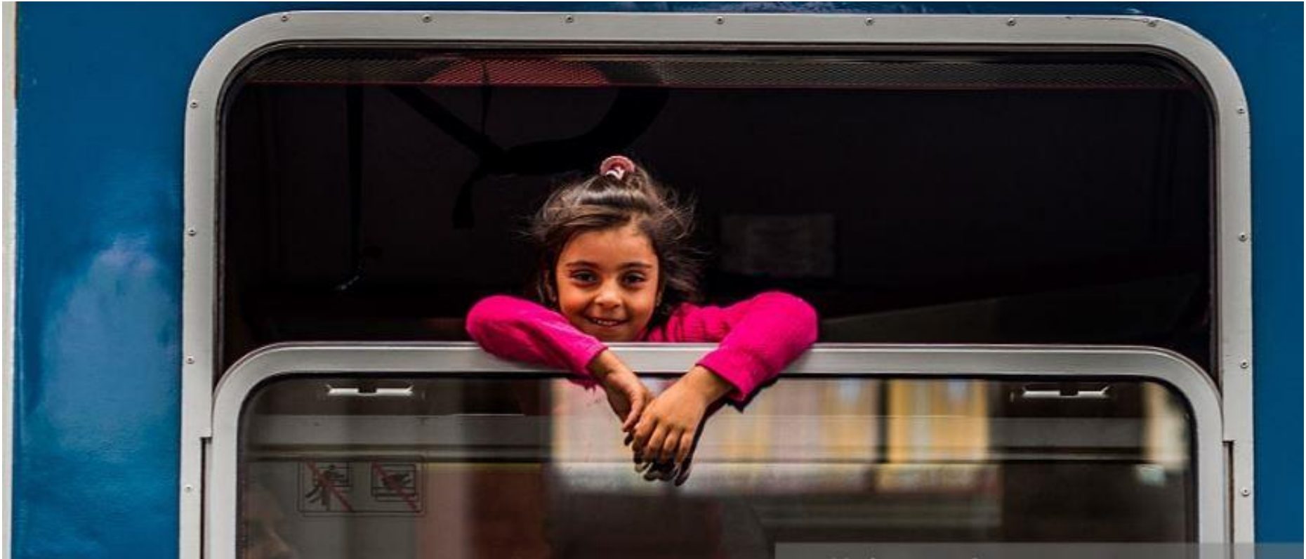
Zug von Budapest nach Wien, 8. Sept. 2015