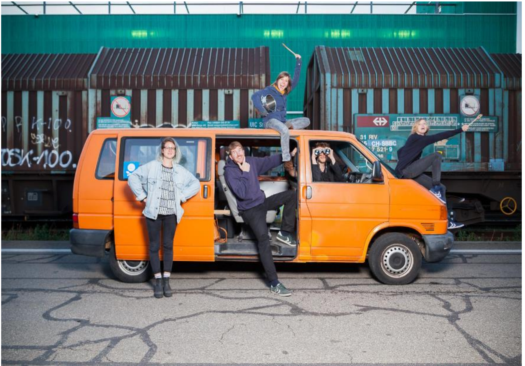
Aktion Rastplatz