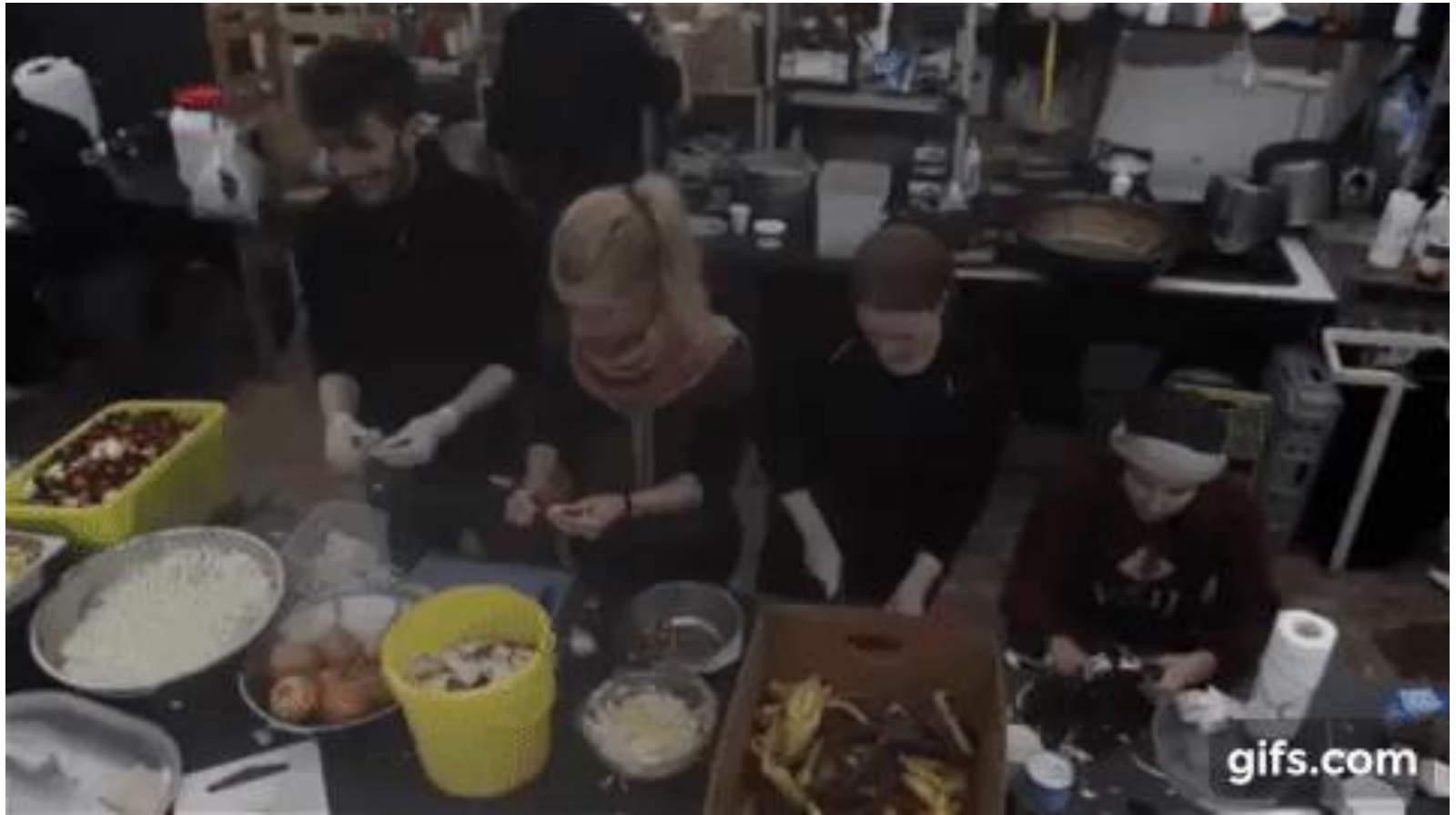
Aktion Rastplatz, Dunkerque in Nordfrankreich