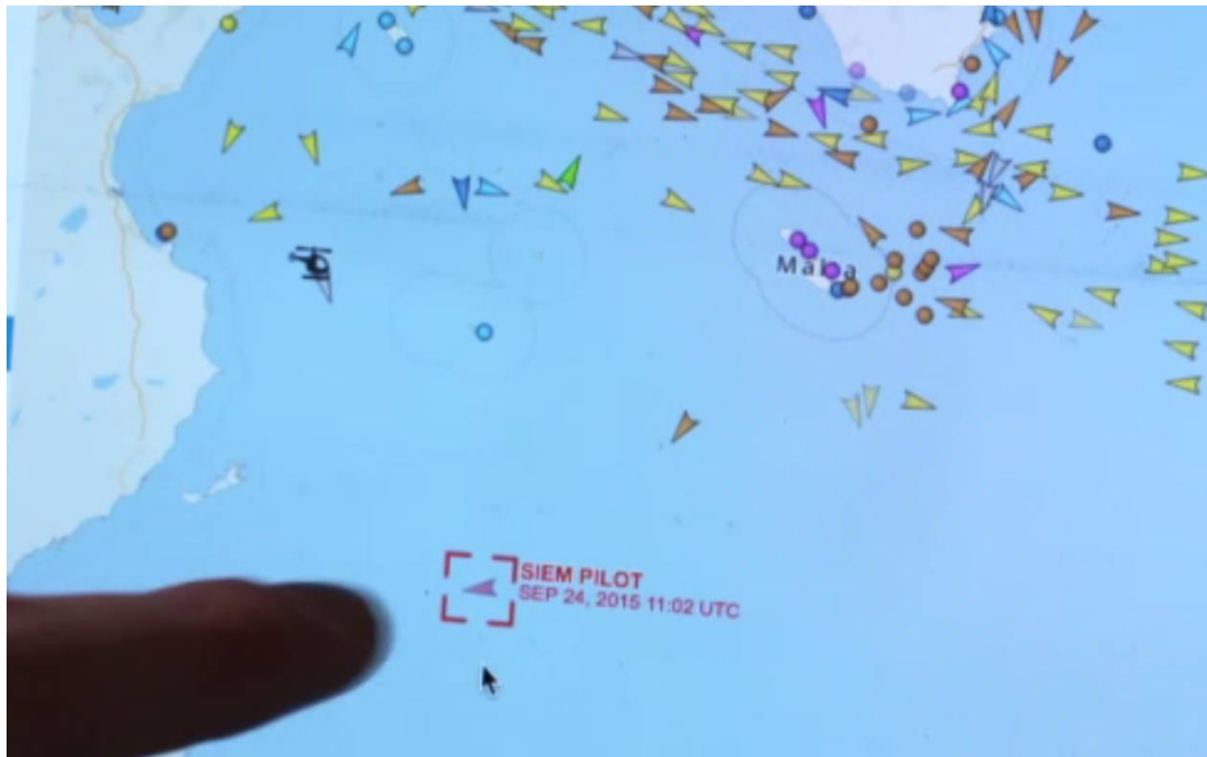
Screenshots, srf-Sendung Einstein über Alarmphone, 7. Sept. 2015