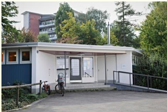
Kindergarten Letzigraben 1 & 2