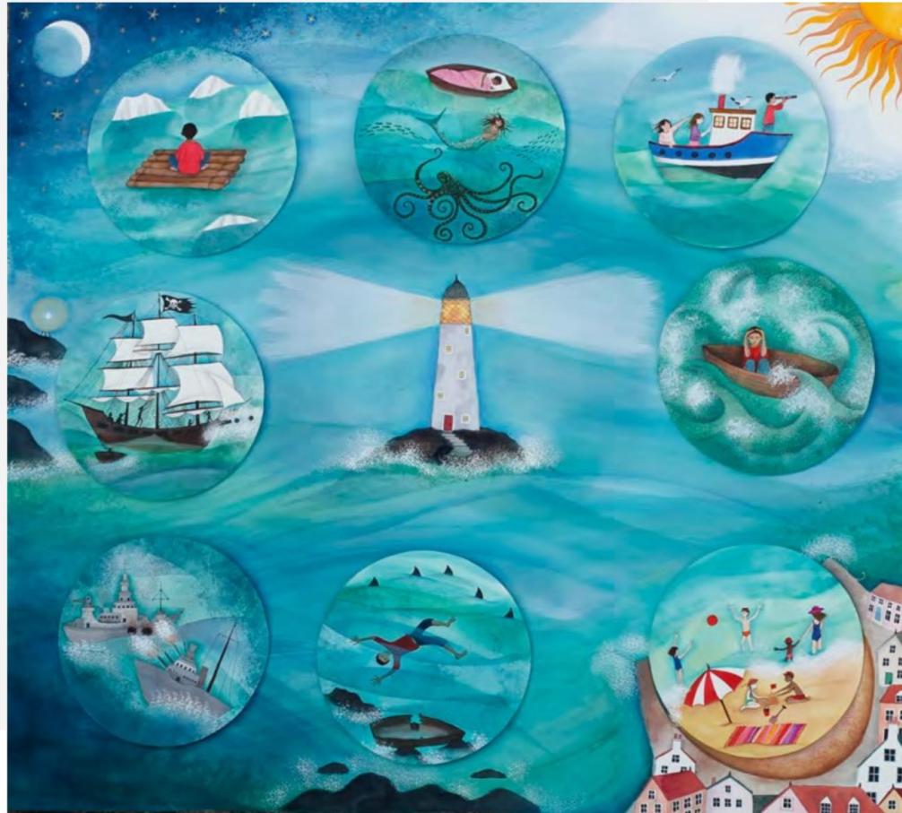
Lighthouseparenting by Gerry Byrne, Oxford

Wie gelingt es mir, im Leben meines Kindes präsent zu sein?