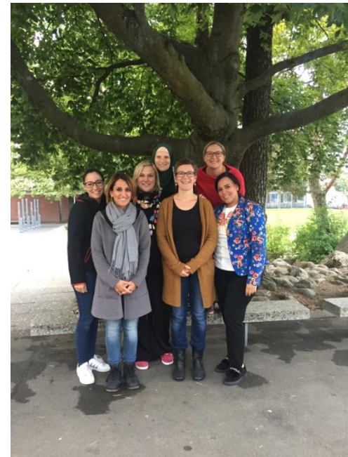
Vorstand Elternforum Schuljahr 2019/2020