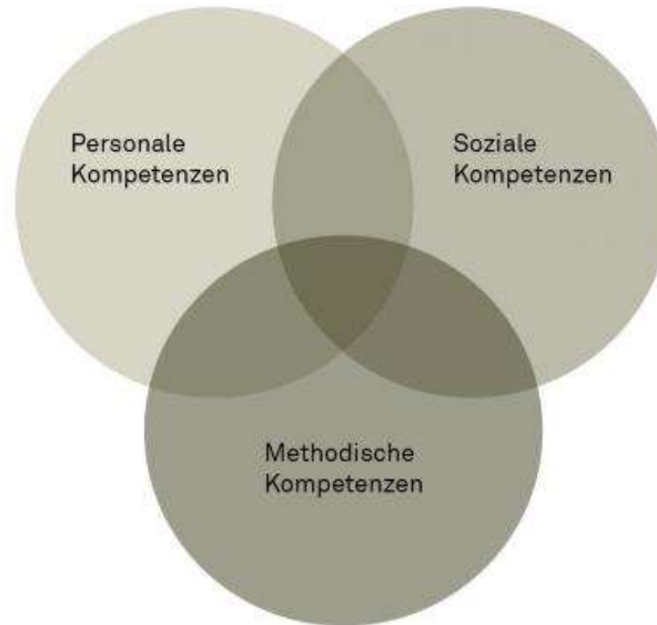
Abbildung 2: Personale, soziale und methodische Kompetenzen und ihre Überschneidungen