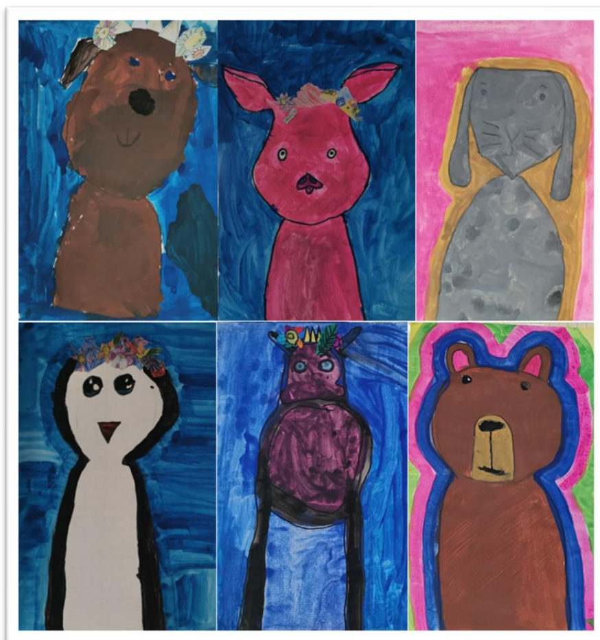
Bilder 2. Klasse Staudenbühl

Redaktion: Susanne Huber Hardegger Renée Mayor Manuela Menghetti Rosita Schaub Jana Giesen