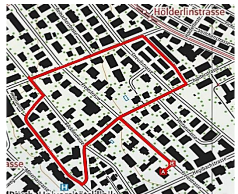
Route: Freiestr. – Jupiterstr. – Heliost. – Lunastr. – Böcklinstr. – Eidmattstr. – Wartstr. – Jupiterstr. – Freiestr.

Auch die Kindergärten führen jede Klasse individuell einen Räbeliechtli-Umzug durch und freuen sich darauf, dass möglichst viele Eltern diesen Abend mit ihren Kindern geniessen. Die Informationen dazu werden von den Kindergärten direkt verteilt.