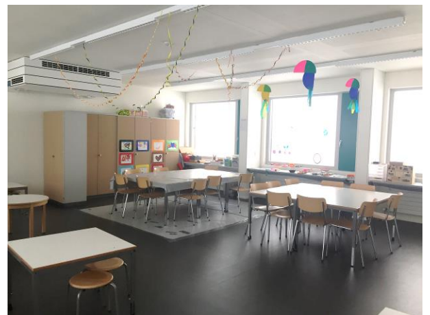
Bastel- und Spielzimmer