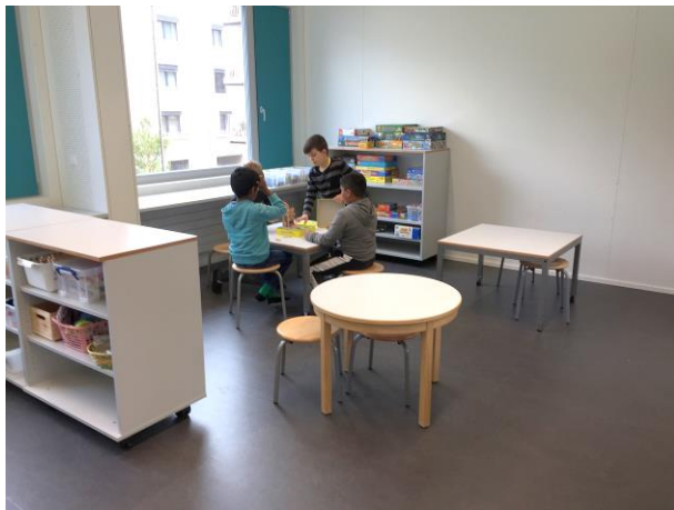
Bastel- und Spielzimmer