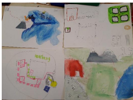
einige unserer Schatzpläne