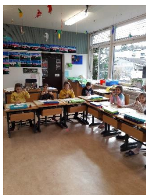
Viel Spass beim Hören der CD im Schriftunterricht