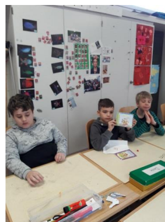
Das Kind der Woche darf die Post öffnen.