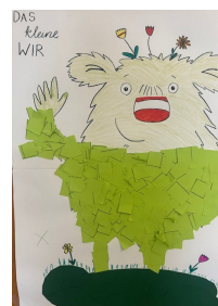
Gemeinschaftswerk Kiga Mh 4