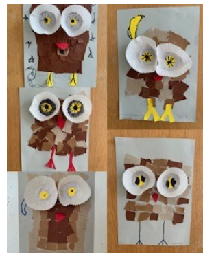
Kunstwerke aus dem MAH Münchhalde 1