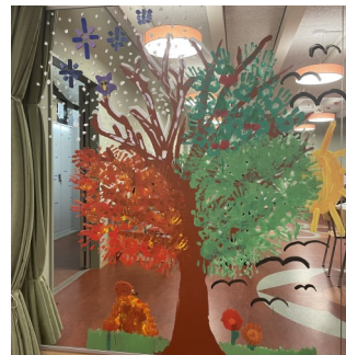
Gemeinschaftswerk MAH Mh 3