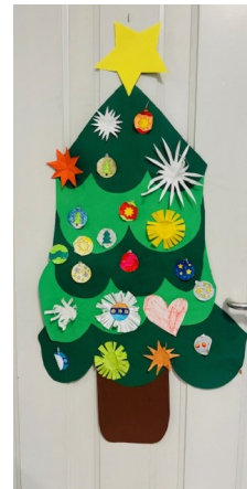
Gemeinschaftswerk Mittagsbetreuung Kartaus