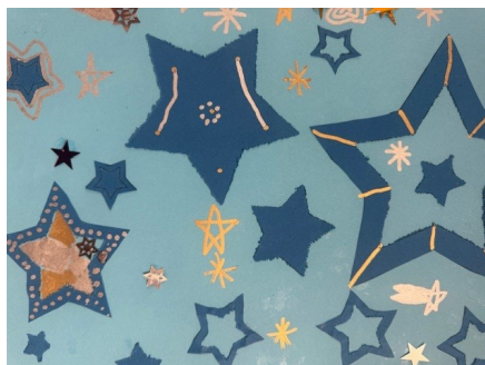
Bildnerisches Gestalten: Kiga Mh 1