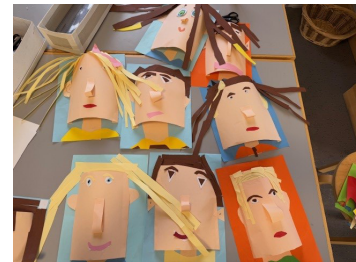
Bildnerisches Gestalten, 1. Kl. Kartaus

Nutzen Sie die Sportferien, um gemeinsam Zeit zu verbringen, sich zu erholen und neue Energie für das kommende Semester zu tanken. Wir freuen uns darauf, nach den Ferien mit frischem Schwung in die nächste Etappe zu starten!