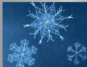
Bildnerisches Gestalten, 6. Kl. Kartauss