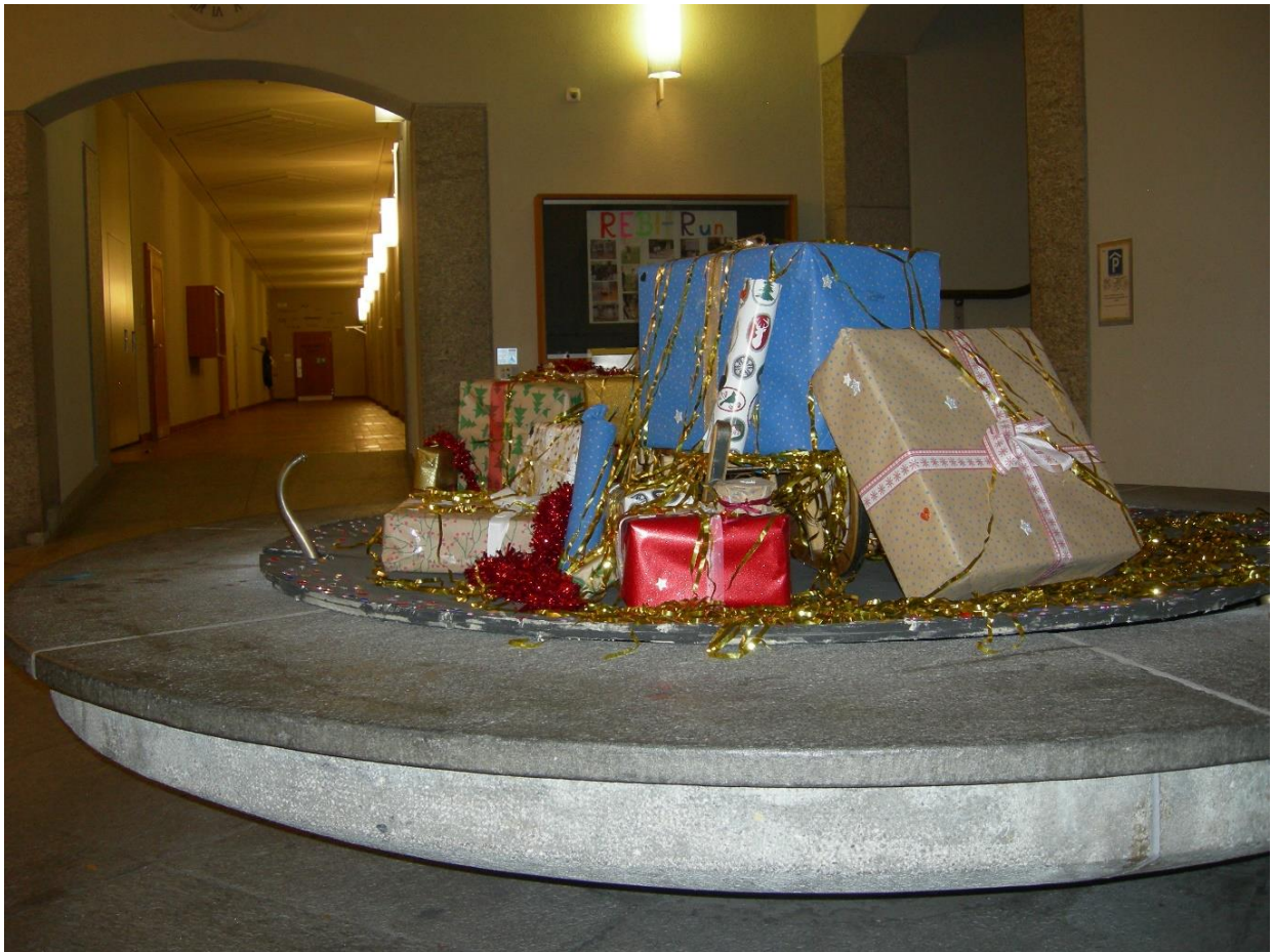
(Advents-Deko im Foyer, 01.12.20)