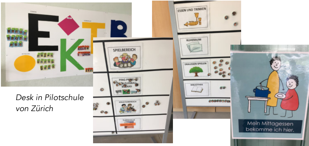
Desk in Pilotschule von Zürich