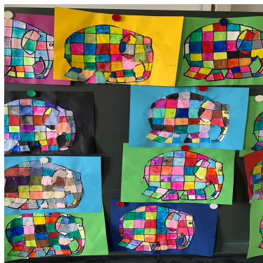
Scherr-Elefanten der Kl. 1B

Ab Schuljahr 21/22 werden im Quartier Oberstrass für die drei Primarschulen Scherr, Hutten und Weinberg/Turner neu schulübergreifende Vorbereitungskurse für die Gymiprüfungen für Gruppen von jeweils 10-12 Kindern angeboten (Deutsch & Mathematik). Die Kurse finden am Mittwochnachmittag statt, stehen allen Sechstklässler*innen der drei Oberstrass-Schulen, die sich auf die Aufnahmeprüfung ans Gymnasium vorbereiten möchten, offen, werden an den drei Schulen durchgeführt und sind gratis. Detaillierte Informationen (Kursinhalte, Teilnahmebedingungen, digitales Anmeldeverfahren) folgen noch vor den Sommerferien.