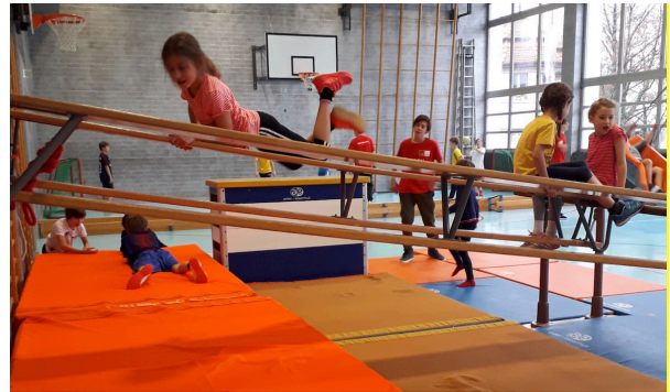
Halbzeit bei Open Sunday