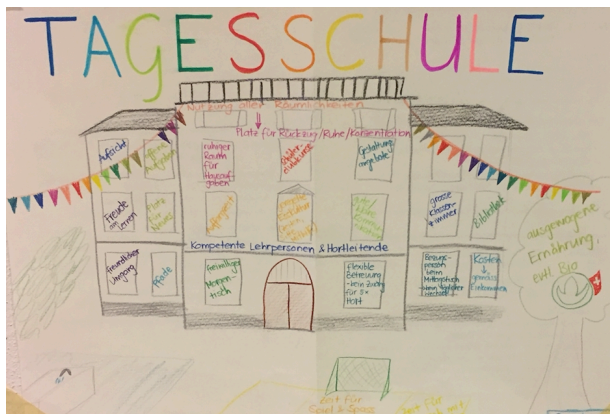
Tagesschule Scherr - Vision

Ab Sommer 2020 wird die Schule Scherr – Zustimmung des Volkes anlässlich der Volksabstimmung vorausgesetzt – als Tagesschule geführt. Wir bereiten uns darauf Schritt für Schritt vor. In diesen Wochen besuchen sämtliche Mitarbeitende der Abteilungen Betreuung & Unterricht in Gruppen eine der folgenden (bereits gestarteten) Tagesschulen: Blumenfeld, Aegerten, Leutschenbach, Am Wasser, Albisriederplatz. Anschliessend an ihren Besuch tauschen sich die Gruppen aus und halten wichtige Erkenntnisse in einem Papier zuhänden der schulinternen Steuergruppe Tagesschule sowie den restlichen Schulleammitgliedern fest. Es geht dabei nicht darum, eine der bestehenden Tagesschulen zu kopieren – jede Schule muss ihr eigenes Tagesschulprofil entwickeln – vielmehr könnten nach dem Motto „Good Practice“ einzelne Elemente übernommen werden.