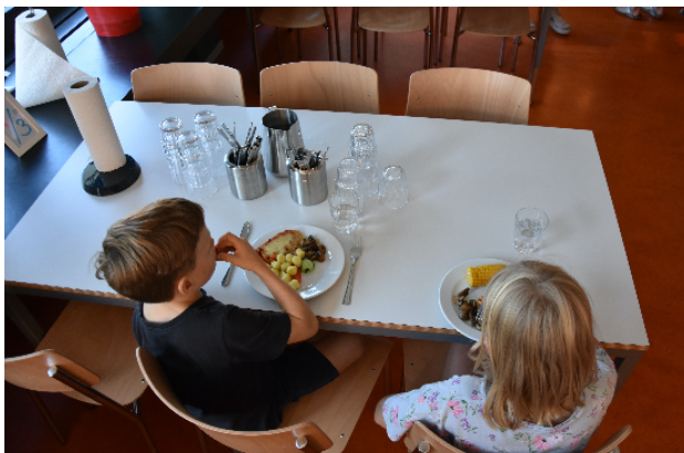
Unser Praktikant Aaron Pushpakaran ist der Fotograf der Fotos