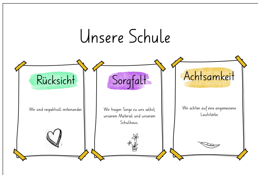
Diese Plakate hängen in allen Räumen der Schule Scherr.

Machen Sie sich mit dem Thema vertraut – im Internet finden Sie dazu zahlreiche Materialien.