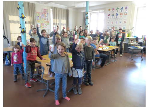
Das Schulparlament feiert einen Erfolg...