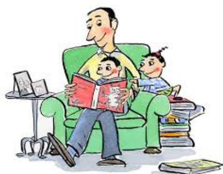
Schweizer Vorlesetag (Mittwoch, 23. Mai 18) www.schweizervorlesetag.ch