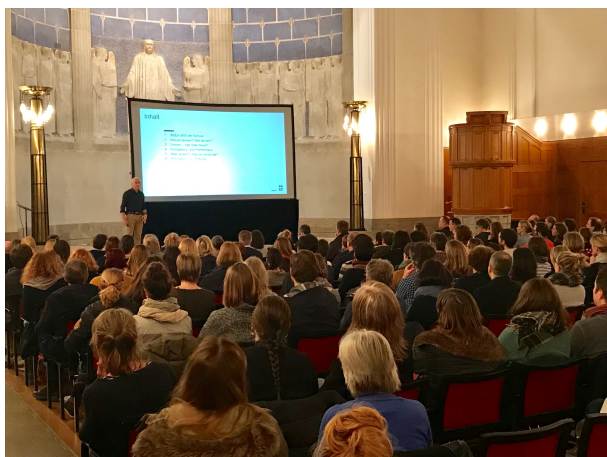
Elternabend Lehrplan 21 (6. März 2018)