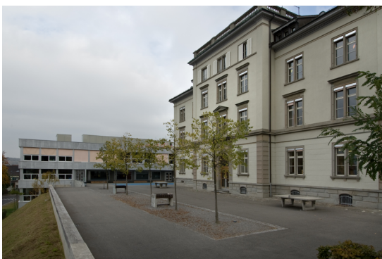
150 Jahre Schule Scherr Spielfest für Kinder & Eltern Freitagnachmittag, 24. Juni 2016