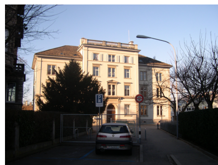
Die Schule Scherr wird 150 Jahre alt...

2016 wird die Schule Scherr 150 Jahre alt, dies möchten wir gemeinsam mit Ihnen feiern. Eine Projektgruppe hat in Absprache mit dem Schulteam ein Konzept erarbeitet – wir machen kein traditionelles Jubiläumsfest mit Festzelt, Bühne, Shows, Reden usw. Vielmehr wollen wir etwas für die Kinder, mit den Kindern und ihren Eltern sowie mit Nachhaltigkeit für die Schule machen. Wir werden im Juni eine Projektwoche „Spiele dieser Welt“ und parallel dazu ein einwöchiges Radioprojekt durchführen und mit ihnen zusammen mit einem Spielfest den Geburtstag der Schule Scherr feiern. Am Spielfest werden Eltern für kulinarische Köstlichkeiten sorgen. Mit den während der Projektwoche entstehenden Spiele entwickeln wir nach dem Jubiläum eine Pausenplatzspielkultur. Machen Sie in Ihrer Agenda am Freitag, 24. Juni 2016 für den Nachmittag ein dickes rotes Kreuz!