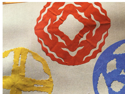
Arbeit vom Schülerclubkurs Gestalten

Ich freue mich zusammen mit den Schulteammitgliedern über ein erfolgreich zu Ende gehendes Schuljahr. Unzählige gelungene Projekte prägten den Schulalltag der letzten Monate. Stellvertretend für solche erwähne ich unsere Sternwanderung, die Erzählnacht und die spannenden Weiterbildungen im Rahmen der Elternmitwirkung. Ich bedanke mich bei Ihnen und allen Mitarbeitenden herzlich für die gute Zusammenarbeit, das Engagement und die wohlwollende Begleitung und Unterstützung. Die Schule ist und bleibt ein spannendes und motivierendes Arbeitsumfeld. Ich wünsche Ihnen und Ihren Familienangehörigen erholsame, sonnige Sommertage.