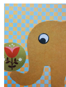
Schülerclubkurs „Gestalten“ – Werke der Kinder (2.-3. Klassen)