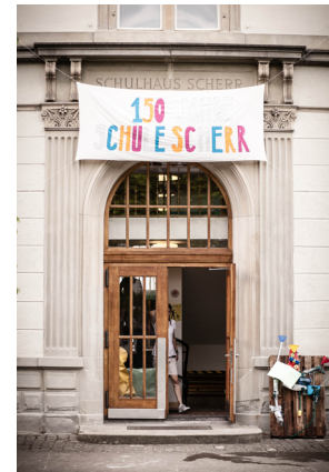
Wir feierten Geburtstag...