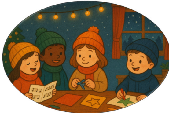
Durch die dunkle Jahreszeit (DDDJ)