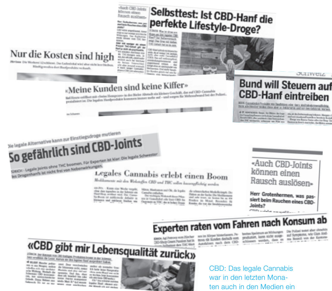
CBD: Das legale Cannabis war in den letzten Monaten auch in den Medien ein grosses Thema.

Auch darauf, weiss niemand so richtig eine Antwort. Eine Untersuchung mit CBD-Hanf im Fahrsimulator würde Aufschluss geben. Die gibt es meines Wissens aber noch nicht. Aus pharmakologischer Sicht ist aber wiederum klar: Die subjektiv erfahrbare beruhigende Wirkung von CBD muss sich negativ auf die Reaktionszeit auswirken. Es ist deshalb sehr davon abzuraten, sich nach dem Konsum von CBD ans Steuer zu setzen – alleine schon aus versicherungstechnischen Gründen.