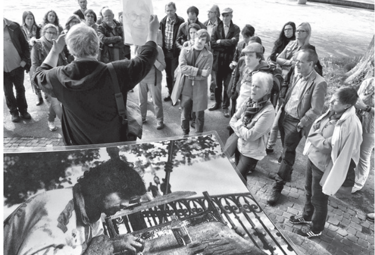
Als der Platzspitz Needle-Park war: Unser Guide zeigt Fotos von damals.

Niederdorf, Limmatquai, Platzspitz: Drei Schauplätze, die mit Zürichs Drogen- und Präventions-Geschichte eng verbunden sind. Unsere Stadtführung «Von der Riviera bis zum Letten» geht dieser nach. Sie erzählt vom Bier der Arbeiter, von den Joints der Hippies, vom Heroin der Fixer und dem Wirken der Suchtprävention. Nächste Führung: Donnerstag, 28. September, von 18-20 Uhr. Treffpunkt: Zwingli-Denkmal beim Helmhäus am Limmatquai. Weitere Infos: www.stadt-zuerich.ch/suchtpraevention