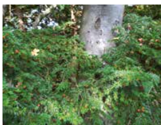
Junge Eibentriebe.

Einst weit verbreitet, ist die Eibe heute in ganz Europa selten geworden. In der Schweiz gehört sie zu den gefährdetsten Baumarten, in Deutschland ist sie gar geschützt. Gründe dafür sind einerseits die Übernutzung durch den Menschen, andererseits das Abfressen der Triebe durch das Rehwild. Am Uetliberg ist die Eibe heute jedoch wieder häufiger anzutreffen. Um die gefährdete Baumart zu fördern, wurden hier «Eibenförderungsgebiete» ausgeschrieben. Der Zürcher Hausberg ist nicht nur in der Schweiz eines der wichtigsten Verbreitungsgebiete der Eibe, sondern mit einem Bestand von zehntausenden Eiben auch von europäischer Bedeutung.