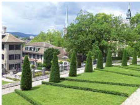
Reihe von Säuleneiben im Rechberg.

Die auch im Winter dekorative, dunkelgrüne Eibe erträgt als einziger Nadelbaum den regelmässigen Formschnitt. Schon in den Renaissance-Gartenanlagen Italiens und den Barockgärten Frankreichs gehörte sie zu den beliebtesten Gartengehölzen. Im Rechberg in Zürich, einem der schönsten Barockgärten der Schweiz, steht eine dekorativ geschnittene Reihe von Säuleneiben. In vielen Grünanlagen wird die Eibe heute noch gepflanzt, da ihre dunklen Nadeln einen schönen Kontrast zu Blumenbeeten und anderen Ziergehölzen bilden. Damit ist die Eibe eine ausgezeichnete einheimische Alternative zu immergrünen Exoten.