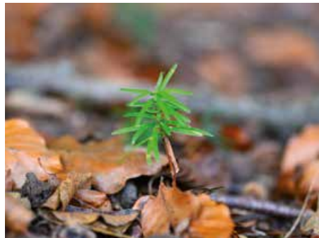
Natürliche Ausbreitung durch Waldtiere.

Im Herbst schmücken sich die weiblichen Eiben mit roten Früchten, womit für viele Waldtiere ein Festessen beginnt. Die Konkurrenz um die begehrten Früchte ist unter den Vögeln so gross, dass Misteldrosseln «ihre» Eibe gegen andere verteidigen. Doch auch bei Mäusen, Füchsen, Dachsen und Wildschweinen sind die süssen Früchtchen beliebt. Schliesslich profitiert auch die Eibe davon: Auf diese Weise werden ihre Samen weit verbreitet, wenn die Tiere sie an anderer Stelle wieder deponieren.