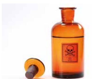
Taxin: Je nach Dosis Gift oder Heilmittel.

Als einziger Waldbaum Europas enthält die Eibe in allen Teilen (ausser dem roten Samenmantel der «Beeren») Taxin, ein starkes Gift. Dessen Wirksamkeit ist sehr unterschiedlich: Rehe können relativ grosse Mengen von Eibennadeln fressen, ohne Schaden zu nehmen. Bei Pferden hingegen wirkt das Gift bereits in geringen Mengen tödlich. Auch für den Menschen kann das Gift tödliche Folgen haben. In Agatha Christies Krimi «A Pocket Full of Rye» (Das Geheimnis der Goldmine) wird ein Geschäftsmann mit Taxin ermordet. Eibengift kommt jedoch seit dem frühen Mittelalter auch für Heilzwecke zur Anwendung, heute vor allem als Krebsmittel.