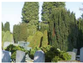
Eiben auf dem jüdischen Friedhof Friesenberg.

Seit dem Altertum steht die Eibe für den Übergang der Seele zwischen den Welten, für Tod und Wiedergeburt. Entsprechend wurde sie verehrt und galt den Kelten als heilig. Wohl deshalb wurde sie häufig auf Friedhöfen gepflanzt. Eibenholz wurde auch für Zauberstäbe und Wünschelruten verwendet. Sogar das traditionelle Schmücken des Weihnachtsbaums geht möglicherweise darauf zurück, dass früher beerentragende Eiben ins Wohnzimmer gestellt wurden.