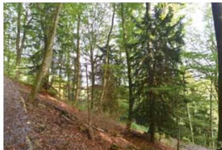
Typisches Steilhang-Habitat am Uetliberg.

Die Eibe ist in ganz Europa verbreitet. In der Schweiz wächst sie hauptsächlich zwischen 500 und 800 m ü. M, denn sie bevorzugt ein mildes, leicht feuchtes Klima. Zugleich ist sie der seltenste aller einheimischen Nadelbäume. Sie wächst sehr langsam, bevorzugt an luftfeuchten Steilhängen und Kreten oder auch im Schatten der mächtigen Baumkronen von Buchen und Ahornen. Diese bieten ihr Schutz vor Kälte, denn die Eibe reagiert empfindlich auf Frost.