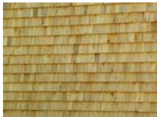
Fassadenverkleidung mit Eibenschindeln.

Das Besondere am Werkhof Albisgüetli ist, dass für die tragenden Strukturen Buchenholz statt des bisher häufig genutzten Fichtenholzes verwendet wurde. Die Fassade wurde mit attraktiv gefärbten, witterungsbeständigen Schindeln aus Eibenholz verkleidet, die das Gebäude vor Schnee und Regen schützen. Auch das Geländer des Balkons ist aus Eibenholz gefertigt. Das für den Bau benötigte Eiben- und Buchenholz stammt aus dem Zürcher Stadtwald. Im Forstgarten des Werkhofes werden junge Eiben nachgezogen, um das Überleben der Eiben am Uetliberg langfristig zu sichern.