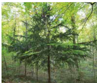
Europäische Eibe (Taxus baccata).

Die Europäische Eibe ist ein Relikt aus dem Tertiär, einem Erdzeitalter das vor 2,6 Mio. Jahren endete. Damit gilt die Eibe als älteste Nadelbaumart Europas. Anders als die mit ihr verwandten, zapfentragenden Nadelbäume schmückt sie sich mit leuchtend roten «Beeren». Verglichen mit anderen Nadelbäumen fallen ihre sehr dunklen Nadeln und der charakteristische, mit Längswulsten versehene Stamm auf. Ebenfalls kennzeichnend ist ihr dichtes, leistungsfähiges Wurzelwerk, welches besonders an Wegböschungen gut sichtbar ist. Dieses ermöglicht es der Eibe auch an sehr steilen Lagen zu wachsen und sich mit Nährstoffen und Wasser aus dem Boden zu versorgen.