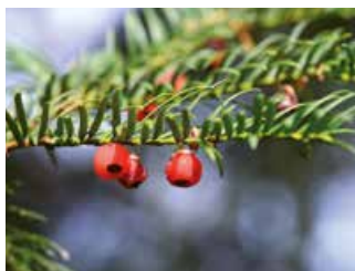
Charakteristische «Eibenbeeren».

Im Gegensatz zu vielen anderen Pflanzen sind die Blüten der Eibe eingeschlechtig. Auf einem Baum kommen entweder nur weibliche oder nur männliche Blüten vor, weswegen eine einzelne Eibe als weiblich oder männlich bezeichnet werden kann. Bereits im Herbst sind die unscheinbaren, kleinen Blüten zwischen den Nadeln an den Zweigenden zu sehen. Weibliche Eiben sind im Herbst mit ihren leuchtend roten «Beeren» gut zu erkennen, männliche verstäuben im Frühling bei leichter Berührung ganze Pollenwolken.