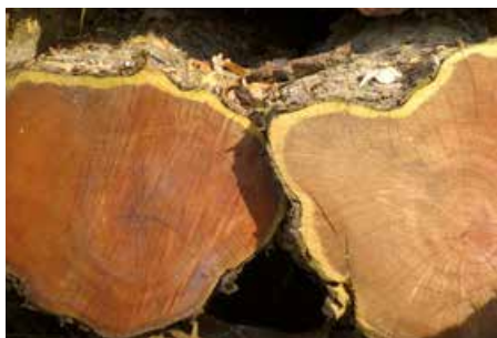
Querschnitt durch Eibenstämme.

Eibenholz ist dekorativ, hart und dauerhaft. Seit Jahrhunderten wird es für die Herstellung von Gebrauchsgegenständen, Drechslerarbeiten, Holzschnitzereien und Kunsthandwerk verwendet. Im Mittelalter war das Holz der Eibe in ganz Europa wegen seiner Stärke und Flexibilität als Material für Langbogen und Armbrust sehr begehrt. Heute kommt das witterungsbeständige Eibenholz zudem auch für Uferverbauungen zum Einsatz. Am Uetliberg wird es für die Einrichtungen des Vitaparcours und zur Befestigung des Biketrails verwendet.