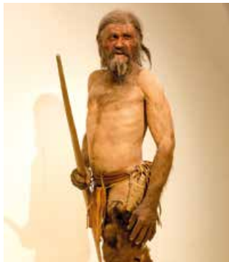
Bereits Ötzi jagte mit einem Eibenbogen.

Schon seit Urzeiten ist das dauerhafte, sehr harte und dennoch elastische Eibenholz für Waffen oder Werkzeugstiele beliebt. Der Steinzeitjäger «Ötzi» war bereits vor 5000 Jahren mit einem Eiben-Langbogen unterwegs. Im Mittelalter war das Eibenholz besonders für die Herstellung von Langbogen begehrt. Um genügend Holz vorrätig zu haben, wurden an den Burghügeln Eiben als Rohstoff für die kriegsentscheidenden Waffen angepflanzt. Dennoch wurden in ganz Mitteleuropa die Eibenbestände durch Übernutzung fast ausgerottet.