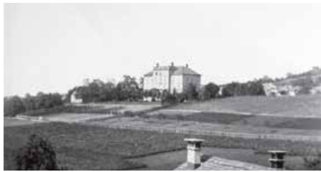
Um 1890 stand das Schulhaus Scherr noch alleine auf weiter Flur.

11 Schulhaus Scherr Das Schulhaus Scherr wurde 1866 als Primarschulhaus eröffnet und ehrt mit seinem Namen den Taubstummenlehrer Ignaz Thomas Scherr (1801–1870), der sich als erster Direktor des Lehrerseminars in Küsnacht um den Aufbau der neuzeitlichen Zürcher Volksschule und Lehrerbildung verdient gemacht hat.