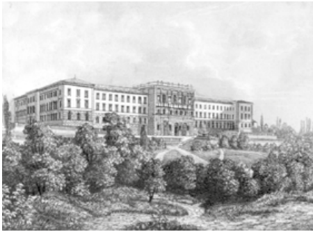
Das Polytechnikum von Semper an der Grenze zu Oberstrass.

2 Tannenstrasse Das zur Altstadt gehörende Polytechnikum, die heutige ETH, wurde vom bedeutenden deutschen Architekten Gottfried Semper geplant und 1864 auch als Sitz der Universität eröffnet. Es prägte die Entwicklung von Oberstrass nachhaltig: Aus dem ehemaligen Arbeiter- und Bauerndorf wurde ein Quartier mit einer hohen Zahl von Studierenden und Dozierenden. 1919 wurde die ETH durch Stadtbaumeister Gustav Gull umgebaut. Die Orientierung des Gebäudes wurde an die Rämistrasse verlegt und der Haupteingang erhielt einen symmetrischen Empfangshof und eine Kuppel – wie die benachbarte Universität.