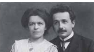
Das Ehepaar Mileva und Albert Einstein um 1912.

8 Huttenstrasse 62 Die Huttenstrasse 62 erinnert an den berühmtesten Physikprofessor der ETH, an Albert Einstein. Einstein war von 1903 bis 1919 mit der serbischen Physikerin Mileva Maric verheiratet, die unbestrittenermassen Anteil an seinen bahnbrechenden Theorien hatte. Wegen unüberbrückbarer Differenzen verlangte er die Scheidung. Mileva willigte ein, erhielt im Gegenzug von Albert das Preisgeld des Nobelpreises, den er 1922 gewonnen hatte.