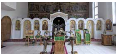
Der prachtvolle Kirchenraum der Auferstehungskirche.

10 Narzissenstrasse 10 1911 wurde die Emmaus-Kapelle vom Verein für Evangelisation eröffnet, der von Gemeindemitgliedern der Chrischona-Kirche aus Oberstrass gegründet wurde. 2004 erwarb die russisch-orthodoxe Kirche das Gotteshaus und richtete es im Innern gemäss ihrem Ritus als Auferstehungskirche ein.