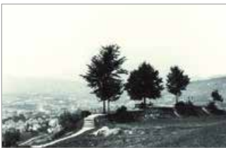
Grab des Dichters Georg Büchner (1813–1837) um 1895.

Neben der heutigen Bergstation der Rigi bahn befindet sich das Grab des bedeutenden deutschen Dichters Georg Büchner, dem der wichtigste Literaturpreis in deutscher Sprache gewidmet ist. Büchner kam 1836 als Flüchtling nach Zürich und wurde hier als 23-Jähriger Privatdozent an der Universität. Vier Monate später verstarb er an einer Typhusinfektion. Er wurde erst auf dem Friedhof Krautgarten, beim heutigen Kunsthau, beerdigt. Bei der Aufhebung dieses Friedhofs wurde sein Grab auf den Germaniahügel verlegt.