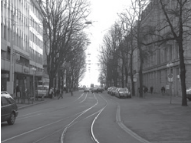
Die Bahnhofstrasse im Bereich zwischen Paradeplatz und Seebecken