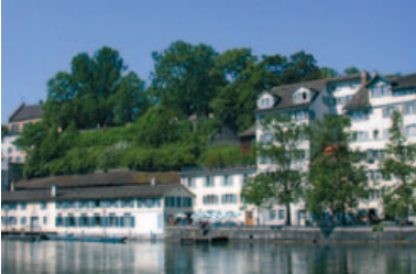
Die untere Schipfe und der Lindenhof bei Tag, bei Nacht und in einer Darstellung zur Idee des neuen Lichtkleides.