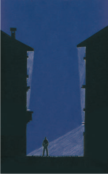
Schematischer Schnitt einer weiteren Art, eine Gasse auszuleuchten.