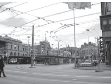
Die Tramhaltestelle dominiert den westlichen Teil des Platzes.