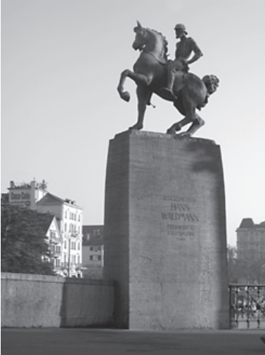
Das Waldmann-Denkmal abgestimmt auf das Umgebungslicht inszenieren.