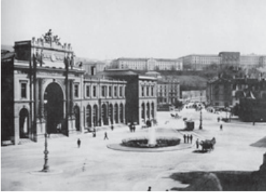
Die gleich proportionierten Fassaden von Bahnhof und Polytechnikum.