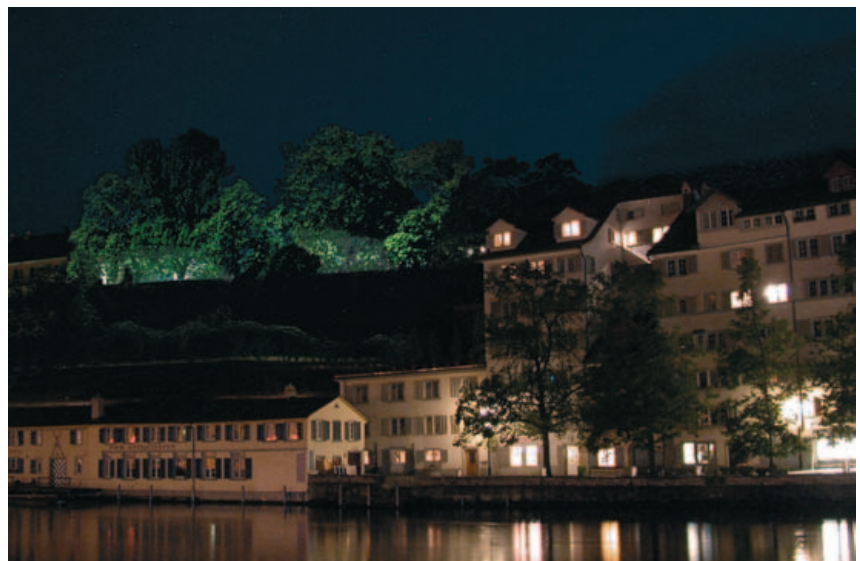
Die Wohn- und kleinen Geschäftshäuser, wie hier an der Schipfe, bleiben zurückhaltend beleuchtet. Dafür kann die Grünanlage des Lindenhofes eine Tiefenwirkung entfalten. Blendende Einzellichter werden ausgeschaltet bzw. mit den Einschaltzeiten koordiniert.