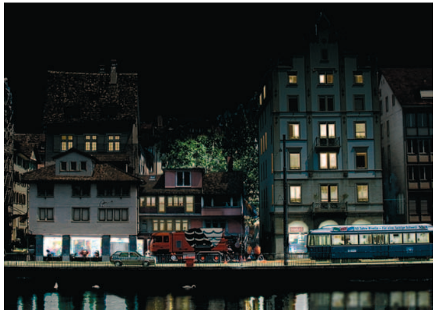
Die wahrscheinliche markante Änderung des Verkehrsraumes Limmatquai bedeutet eine besondere Chance für das Gesamt- bild: Der Vergleich mit einem möglichen Lichtausdruck zeigt als Beispiel die Tiefenwirkung zum Rosenhof, die zurückhaltende Betonung der Gebäude vor dem Verkehrsraum und der dunklen Quaimauer. Die Abstimmung der Schaufensterbeleuchtung mit dem Plan Lumière wird unerlässlich.