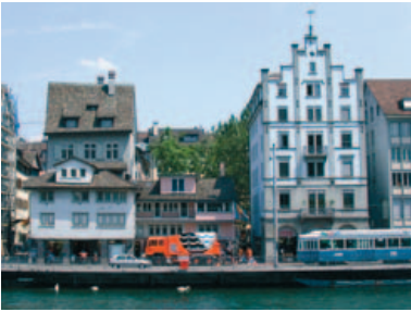
Limmatquai beim Rosenhof bei Tag, bei Nacht und in einer Darstellung zur Idee des neuen Lichtkleides.