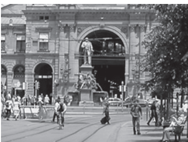
Der Brunnen vor dem Portal.