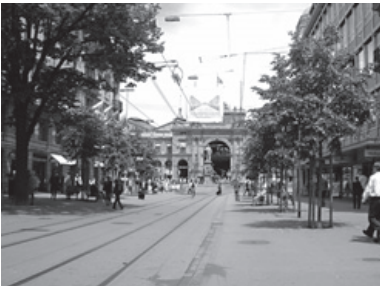
Die Achse der Bahnhofstrasse endet im Portal des Bahnhofes.