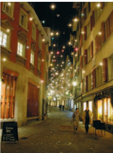
Gassen haben manchmal ein Erscheinungsbild, das nicht verändert werden muss, ebenso sollen Festbeleuchtungen berücksichtigt werden.

Oben der Rindermarkt zur Weihnachtszeit, rechts eine Studie für Lausanne des Atelier Roland Jéol.