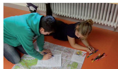
MAP Züri-Zeichner beim Routenplanen

Die MAP Züri-Zeichner lernen den Mobilitätsstadtplan «MAP Zürich» und den Umgang mit einer Stadtkarte kennen: welche Inhalte sind vorhanden, wie liest man eine Legende, wie nutzt man ein Strassenverzeichnis, was ist ein Koordinatensystem etc. Die Schülerinnen und Schüler stellen in Gruppen einen Quartiersspaziergang anhand ihrer Lieblingsorte zusammen und laufen diesen ab. Dazu nutzen sie den MAP Zürich.