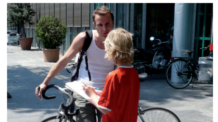
Verhaltensguru bei der Befragung

Als Verhaltensgurus beobachten und erfragen die Kinder die Mobilitätsgewohnheiten der Quartierbevölkerung. In diesem Modul erhalten die Schülerinnen und Schüler einen kurzen Einblick in aktuelle Zahlen der Mobilitätsbefragung Mikrozensus. Mit einem selbst entwickelten Fragebogen interviewen die Schülerinnen und Schüler an ausgewählten Standorten Passantinnen und Passanten. Sie werten die Daten aus und präsentieren die Resultate der Klasse.