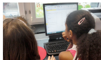
ZüriPlan-Talente lösen Aufgaben

Die ZüriPlan-Talente lernen mit Übungen den Umgang mit dem interaktiven Fuss- und Veloroutenplaner «ZüriPlan». Die Schülerinnen und Schüler planen einen ihnen bekannten Freizeitweg (zum Beispiel mit den öffentlichen Verkehrsmitteln ins Schwimmbad) mit dem Fuss- und Veloroutenplaner, vergleichen die Resultate mit ihren Erfahrungen und besprechen diese gemeinsam in der Klasse.