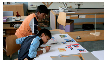
Werbefreaks bei der Gestaltung des Plakates

Die Werbefreaks reflektieren die Werbung und erstellen eigene Werbung zu einem ausgewählten Verkehrsmittel. In diesem Modul wird den Schülerinnen und Schülern dargelegt, wie die verschiedenen Verkehrsmittel in der Werbung mit unterschiedlichen Attributen und Klischees beworben werden. Die Kinder sammeln Bilder in Zeitschriften und im Internet und machen ihre eigene Werbung zu einem Verkehrsmittel oder zu einem Mobilitätsthema mit Slogan und Fotos in Form eines Plakates.