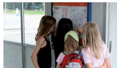
Beim Stadt-OL mit dem Tram unterwegs

Zu Fuss, mit dem Tram oder Bus versuchen die Kinder möglichst schnell die vorgegebenen Posten in der Stadt zu finden und die Fragen zu beantworten. Die Kinder lernen das Liniennetz der öffentlichen Verkehrsmittel kennen. Sie nutzen es selbständig und überlegen, mit welcher Fortbewegungsart sie am schnellsten zum Ziel kommen. Die gewählten Routen werden verglichen und die Erfahrungen ausgetauscht.