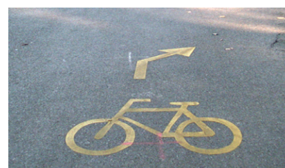
Velomarkierung auf Züricher Strassen

Als Veloplaner erhalten die Schülerinnen und Schüler Einblick in die Aufgaben eines Verkehrsplaners. Welche Nutzergruppen sind auf unseren Strassen unterwegs, welche Ansprüche werden an den Strassenraum gestellt und wie sehen gute Lösungen aus? Die Kinder denken über eigene Lösungsvorschläge nach und lernen unter fachkundiger Führung einige Umsetzungen in der Praxis kennen.