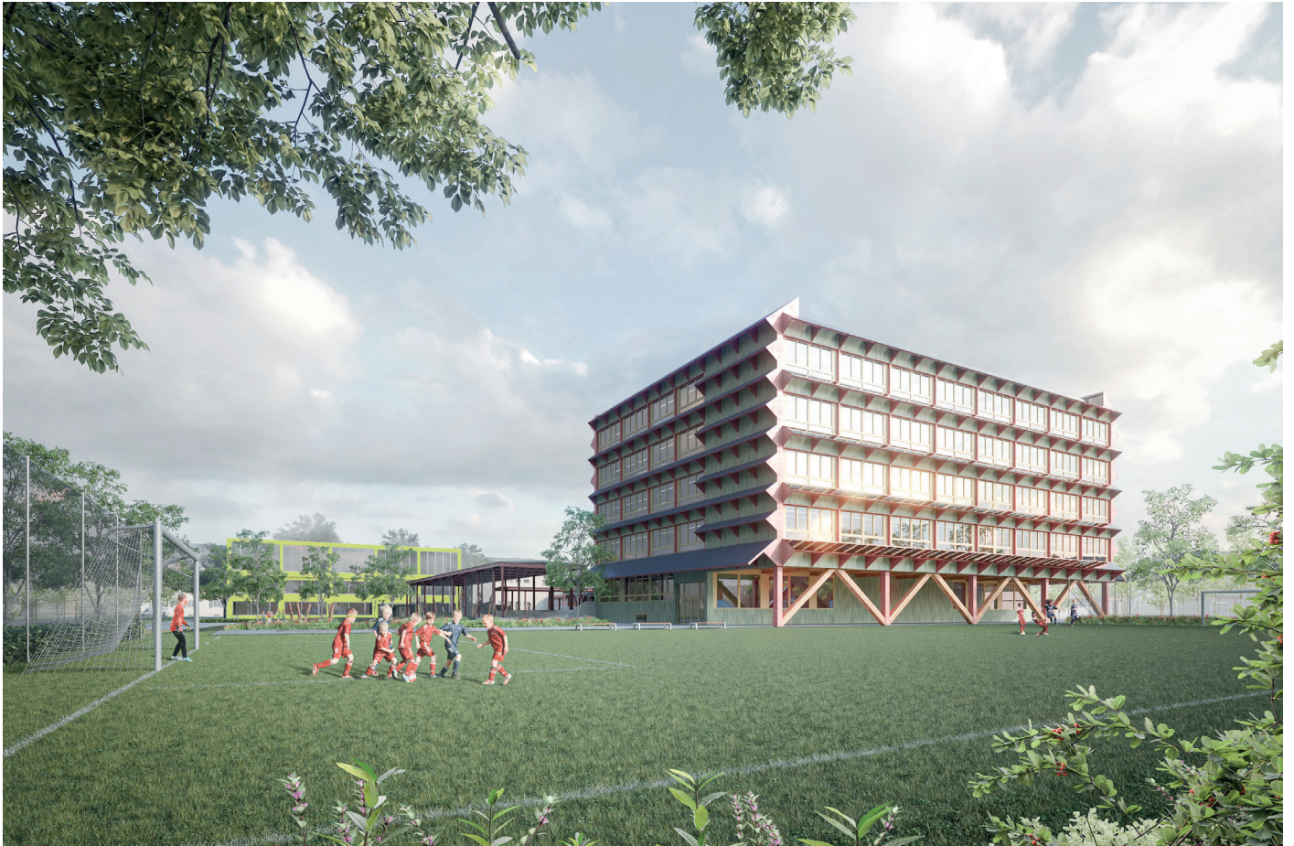
Erweiterung Schulanlage Luchswiesen, Ansicht Nordost, PARAMETER Architekten