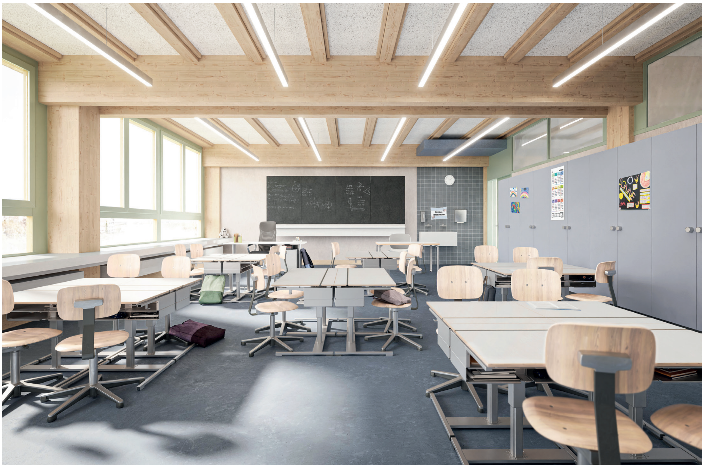
Erweiterung Schulanlage Luchswiesen, Visualisierung Klassenzimmer, PARAMETER Architekten