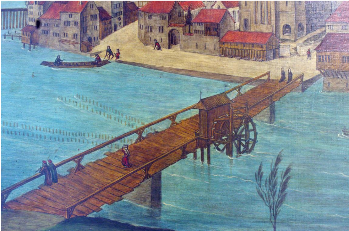
Abbildung 5: Ausschnitt aus den Altartafeln von Hans Leu d.Ä.