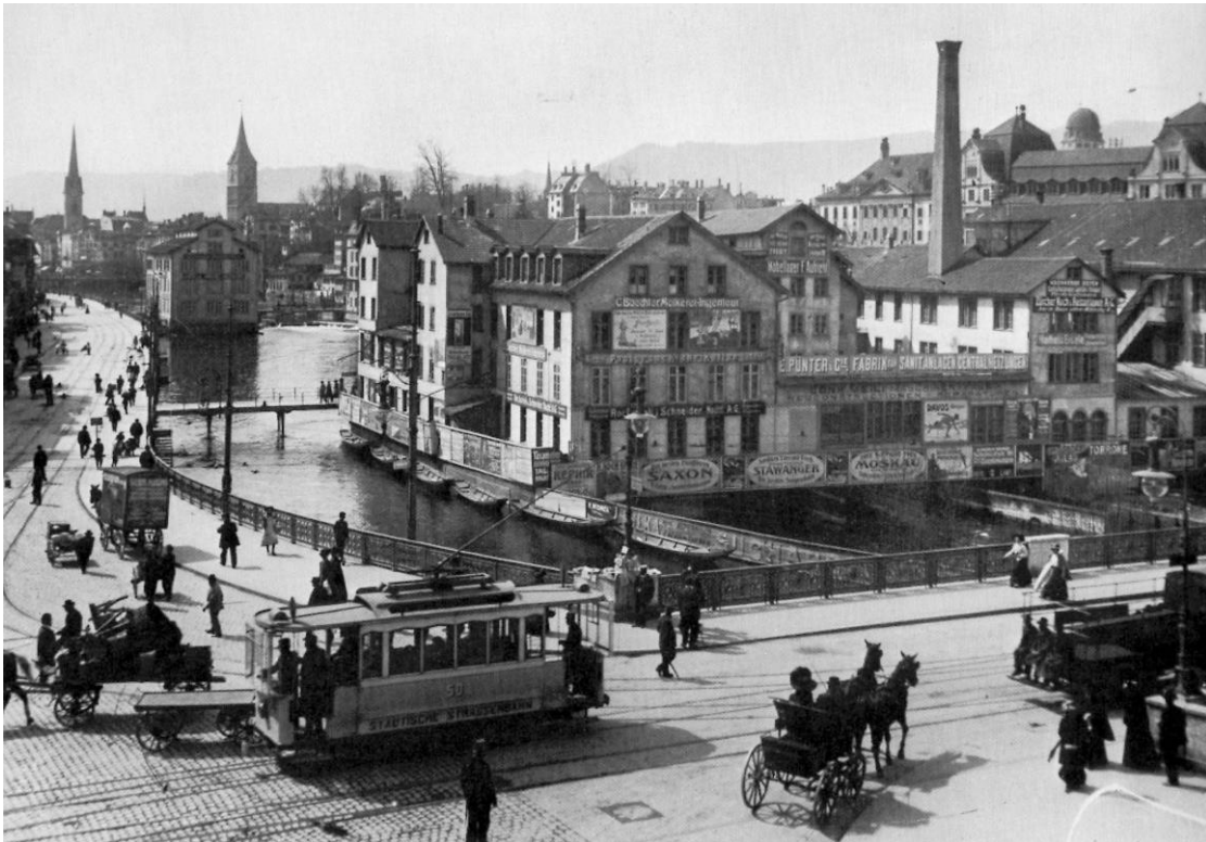
Abbildung 1: Foto vom Central und unterer Mühlesteig, 1910