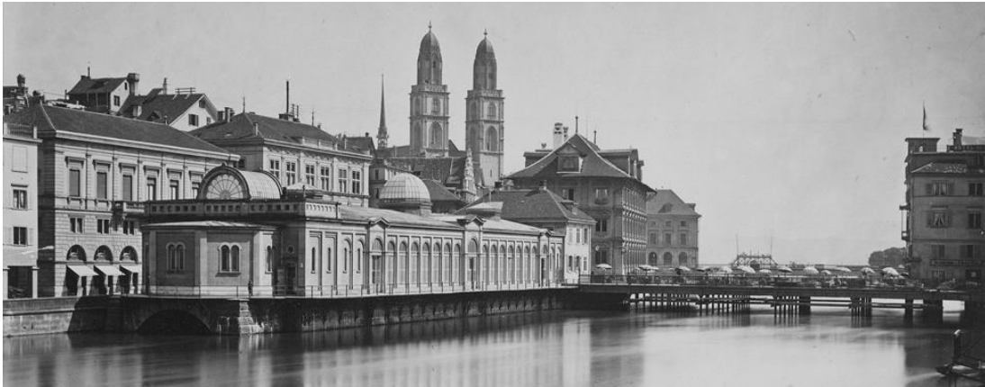
Abbildung 4: 1962 wurde die Fleischhalle abgebrochen. im Hintergrund die Rathausbrücke.