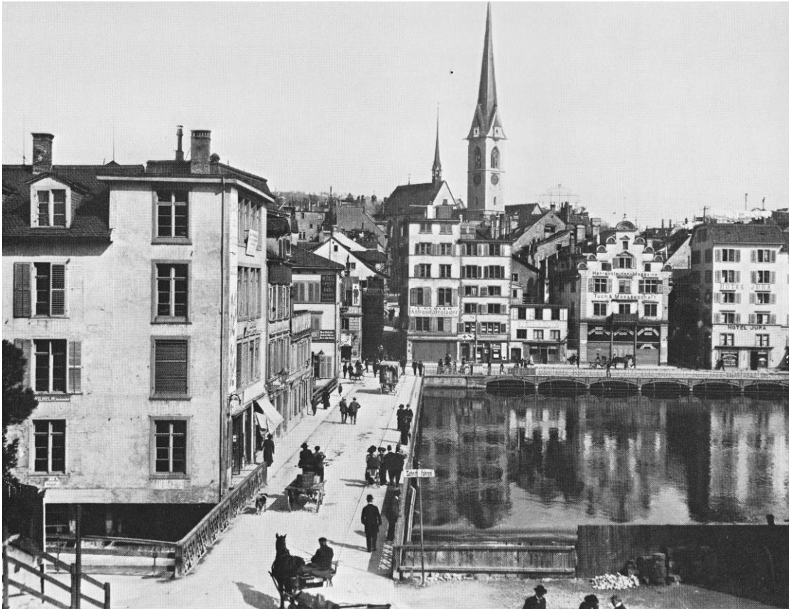
Abbildung 2: Der obere Mühlesteig um 1905, vor dem Bau der Uraniabrücke und der Verbreiterung der Mühlegasse, links die über der Limmat gebauten Mühlen.