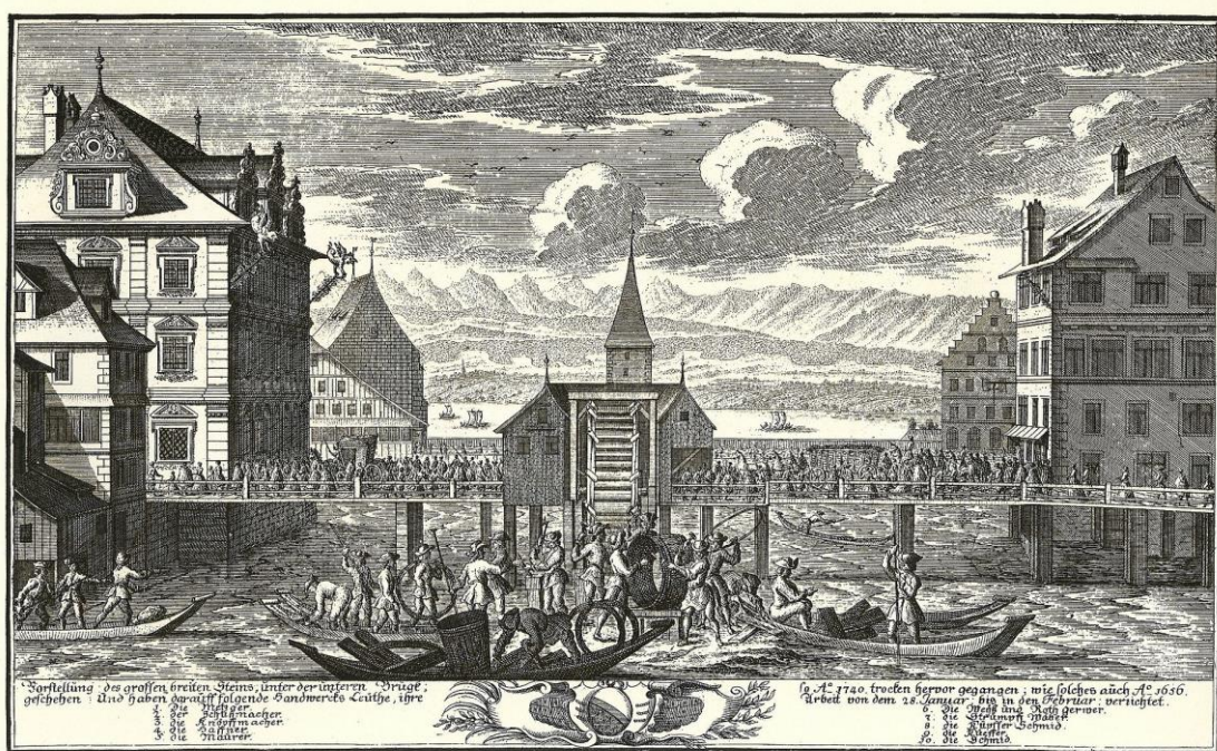
Abbildung 3: Bild: Wikiwand, Public Domain, Kupferstich von Johann Caspar Ulinger Rathausbrücke im Jahre 1740: in der Mitte das Schöpfrad, dahinter der Wellenbergturn; links das Rathaus, rechts das Hotel zum Schwert; im Vordergrund sind Handwerker auf