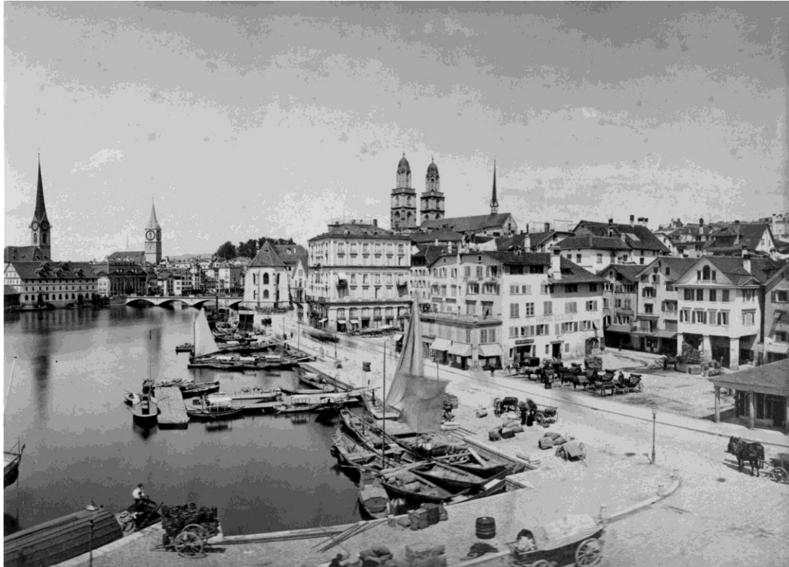
Abbildung 7: Sonnenquai 1871 mit Schifflande. In der Bildmitte, links neben den Pferdekutschen das Haus zum Raben