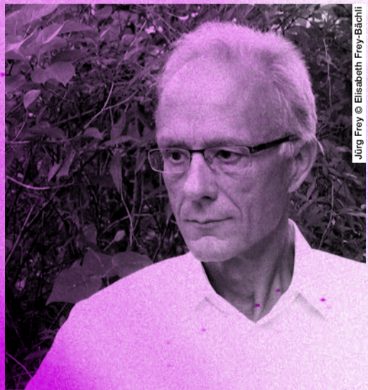
Jürg Frey

IMMER 19.30 UHR Eintrittspreise: 20.–/15.– (ermässigt) Vorverkauf: ticketino.com