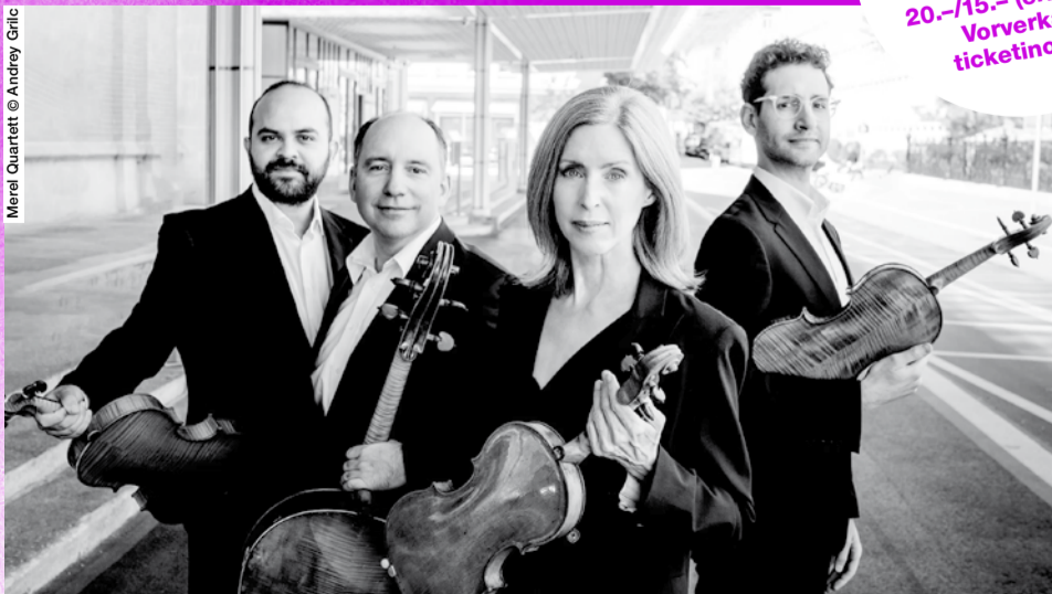
Merel Quartett