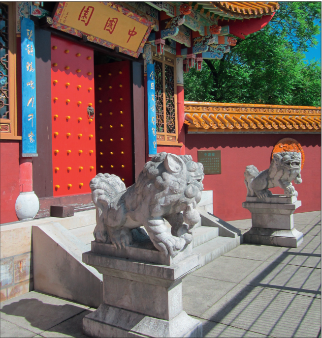
正门左右两边均贴有对联，表示昆明的地理位置处于“黄金马山”（东面）与“雄鸡玉山”（北面）之间。

廊亭中存有超过五百幅中国式山水与静物画。横梁上雕刻的半拱形雕纹是云南省园林建筑的特有标志。由廊亭入口稍事前行，就能观赏到拱月门与竹林。拱月门圆弧式的形状在中国文化里象征着圆满与和谐。