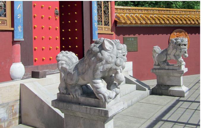
Les inscriptions à gauche et à droite de la porte principale résument la situation géographique de Kunming entre la «Montagne du cheval doré» (à l'est) et la «Montagne du coq vert de jade» (au nord).

Plus de 500 images de paysages et de natures mortes décorent les galeries ouvertes. Les demi-arceaux sculptés au-dessus des poutres transversales sont l'une des principales caractéristiques du jardin du Yunnan. Un court chemin tortueux invite à flâner le long du bosquet de bambous et devant la porte lunaire. Ses formes rondes symbolisent la plénitude et l'harmonie.