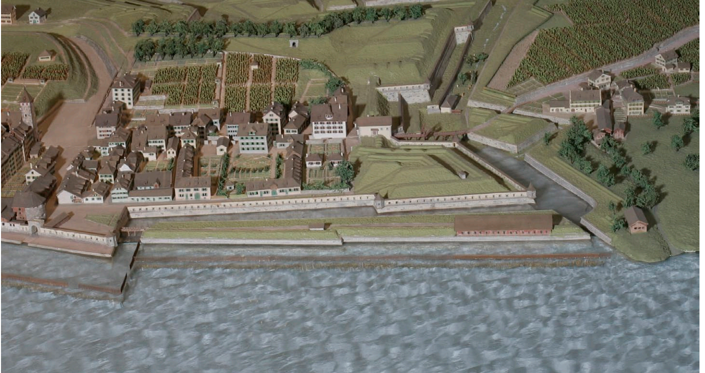
1 Stadelhofen im historischen Stadtmodell «Zürich um 1800». Links: das Oberdorfstor, in der Mitte die Stadelhoferporte mit Steg (heute oberer Stadelhoferplatz), rechts: die Gebäudegruppe mit der Stadelhofer Mühle.

Beamten – ein Meier, ein Kellner, ein Hirt, vier Fischer. Weitere Bestandteile der Grundherrschaft waren eine Taverne und die Stadelhofer Mühle. Auch ein Fischweiher des Fraumünsters lag hier, der vielleicht ursprünglich zum königlichen Stadelhof gehörte, später zum Klosterhaushalt.