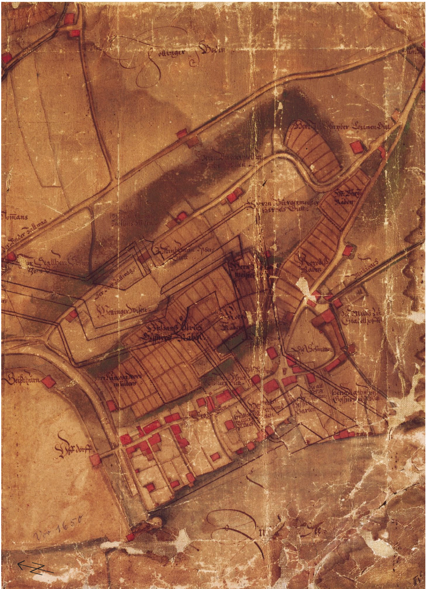
2 Stadelhofen vor dem Bau der barocken Befestigung. Anonymer Projektplan um 1640.