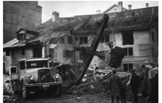
8 Abbruch des «Stadelhofs». (1934)

Die Leitungsbauten und die Neugestaltung der Oberfläche des Stadelhoferplatzes im Jahr 2009 ermöglichten es der Stadtarchäologie, Strukturen aus der Zeit vor und während des Schanzenbaus punktuell zu dokumentieren. Die beobachteten Schichten reichten allerdings nicht vor das 15. Jahrhundert