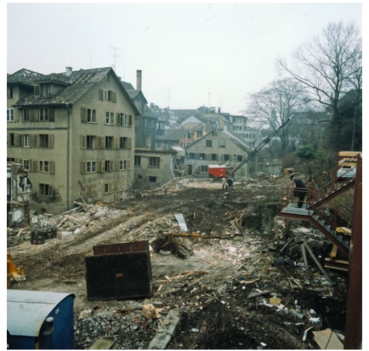
6 Abbruch des alten Stadelhofen für die Neugestaltung des Bahnhofs. Links: das Haus «Bockskopf». (1980)

Kopf eines Schafbocks an der Fassade des viergeschossigen Gebäudes. Schon Bullinger hielt im 16. Jahrhundert in seiner Zürcher Geschichte das Haus für «sehr alt». Die Bauuntersuchung von 1979/80 ergab als ältesten Gebäudeteil einen später erweiterten Kernbau mit Rundbogenportal (Abb. 5). Ein Geschossbalken aus Eiche ist in die zweite Hälfte des 15. Jahrhunderts dendrodatiert. In den Jahren zwischen 1648 und 1660 wurde – ebenfalls gemäss Jahrringchronologie – das Haus bedeutend erweitert und zu einem repräsentativen städtischen Wohnsitz für vornehme Bewohner ausgebaut, darunter Junker Seckelmeister und Bürgermeister Hans Conrad Escher (1743–1814). 1980 musste es dem Bau der Stadelhofer Passage von Architekt Ernst Gisel weichen (Abb. 6).