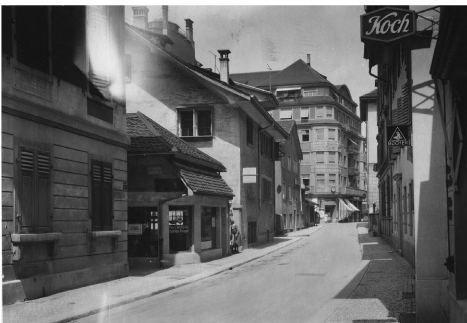
7 Blick durch die alte Stadelhoferstrasse Richtung Innenstadt. Links in der Mitte: das Haus «Stadelhof». (1930)

Bereits 1934 abgetragen wurde das Haus «Stadelhof» (Stadelhoferstrasse alt 27). Der charakteristische Grundriss des mehrgliedrigen Gebäudekomplexes findet sich schon auf dem Plan von 1640 dargestellt. Der zweigeschossige Bau war unterkellert und wies eine eindruckliche spätgotische Befensterung