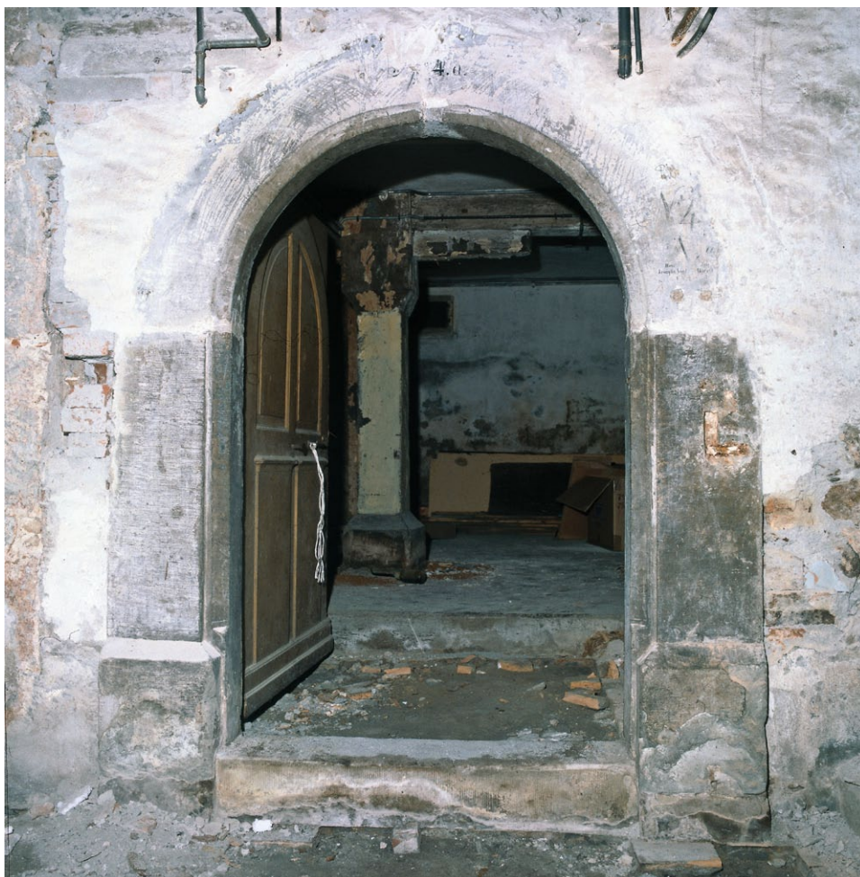
5 Stadelhoferstrasse alt 24 «Bockskopf». Rundbogenportal und Studkonstruktion des ältesten Gebäudeteils aus der 2. Hälfte des 15. Jahrhunderts. (1980)