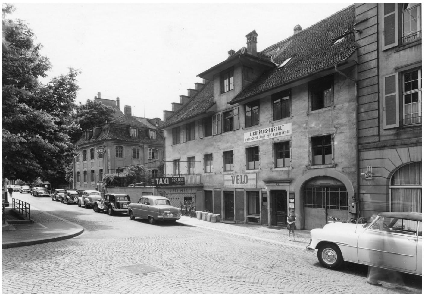
9 Verschwundene Bauten an der unteren Mühlebachstrasse. Rechts: die Stadelhofer Mühle (Abbruch 1970), links: das Haus Mühlebachstrasse 8 (Abbruch 2010). (1954)